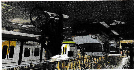
Être toujours visible des conducteurs.